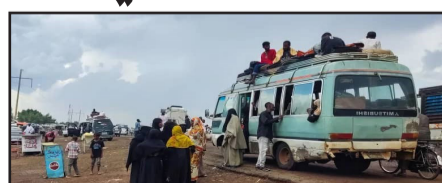
ما أوردته وكالة الصحافة الفرنسية.

وأظهر تعداد لوكالة الصحافة الفرنسية -استناداً إلى مصادر طبية وناشطين- مقتل 200 شخص على الأقل في ولاية الجزيرة الشهر الماضي، إذ صعدت قوات الدعم السريع هجماتها هناك "بعد انشقاق أحد قادتها وانضمامه إلى الجيش".