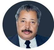
رحمة الله تشاك با أبا رامي