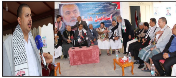
العدوان الصهيوني المستمرة في غزة والتي تستهدف المدنيين الأبرياء من النساء والأطفال... * التفاصيل ص 4