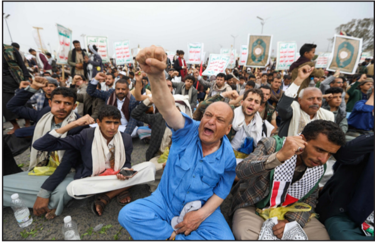
الحياد في المواجهة المرتقبة. عمليات أميركية لمحاولة صد هجمات يمنية ضد إسرائيل. كما عدوا تصريحات ابن فرحان، والتي دان فيها اغتيال هنية، بمثابة إعلان