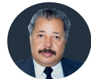
رعة الله نغشاك يا ابا رامي