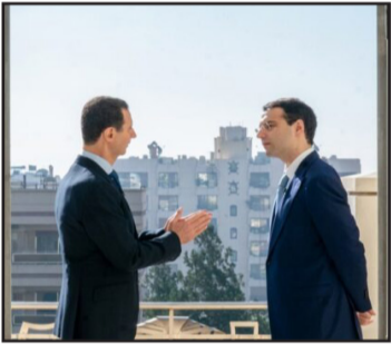
* نص الحوار ص 6

سياسي وفكري مع وزير خارجية أبخازيا "إينال أردزينا": لا يعلم الكثيرون أن الغرب عملياً قد شنّ هجوماً على سورية عام 2011 من أجل أن يفشل تشكيل اتحاد دول عظمى في الشرق الأوسط هي إيران وتركيا وسورية، لو قام هذا الاتحاد لكان الشرق الأوسط منذ سنوات عديدة مضت قد أصبح لاعباً مهماً في الساحة الدولية، وكان قد خرج تماماً من تحت سيطرة الغرب..