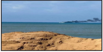
أي سفينة متجهة إلى «الكيان» من الهند، حتى قبل أن تستخدم الجسر البري المفترض، سيتم ضربها كما لو كانت تمر عبر البحر الأحمر.

وقد تعرضت سفينة متجهة إلى الهند للقصف في وقت سابق من هذا الشهر من قبل القوات المسلحة اليمنية، مما يدل على قدرتها على منع أي جسر بري قد تدعمه الهند من خلال السفن المتجهة إلى الإمارات العربية المتحدة.