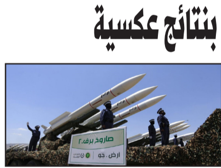
عن شعور طبقة قيادة ضعيفة بالحاجة إلى التصرف، عندما يخطر عدو أو منافس في استفزاز، حتى لو كانت هذه التصرفات ستؤدي إلى نتائج عكسية.. معتبراً أنّ القادة الضعفاء غير قادرين على اتخاذ قرارات صعبة بناءً على الأدلة والمنطق، وبدلاً من ذلك يهاجمون - ولو بشكل غير فعال - بحيث يبدو الأمر كما لو أنهم يعالجون المشكلة.

ويأتي نشر التقرير بالتزامن مع شنّ طائرات العدوان الأمريكي - البريطاني خمس غارات جوية جديدة، اليوم، على منطقة رأس عيسى بمدينة الصّليّف شمال غرب مدينة الحديدة.