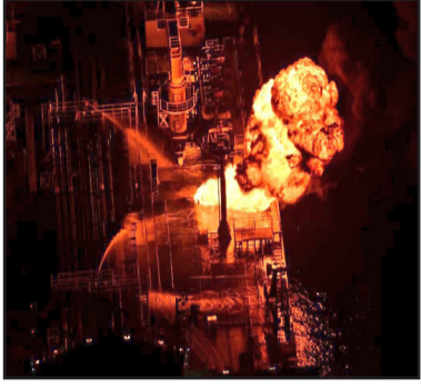
اعتراض للطائرات المسيّرة والصواريخ المضادة للسفن.

وقالت مصادر ملاحية، إن «يو إس إس ميسون» لم تُسحب من مكانها بالقرب من السواحل الإثيوبية، لكنها كما يبدو تخضع لصيانة منذ أسابيع، فيما لم تعلن البحرية اليمنية أيضاً عن استهداف البارجة لأنها تتعمد إيصال رسائلها إلى الخصم، وتنتظر إعلان تفاصيل الأحداث منه.